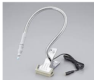
ほっぺタッチスイッチ