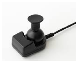
アナログジョイスティック